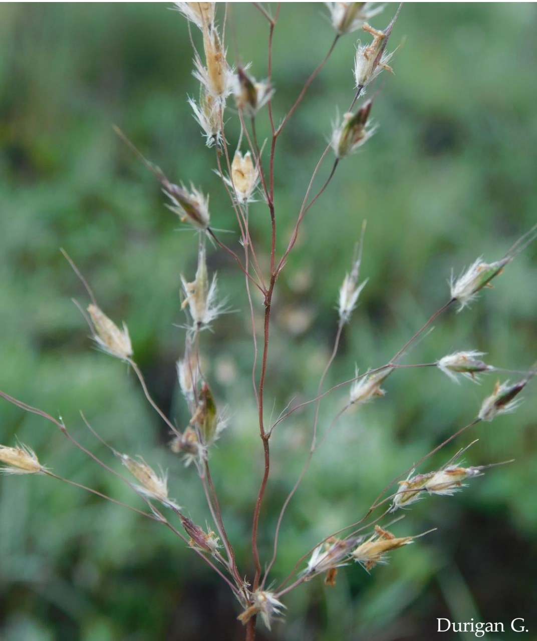
Arthropogon villosus Nees