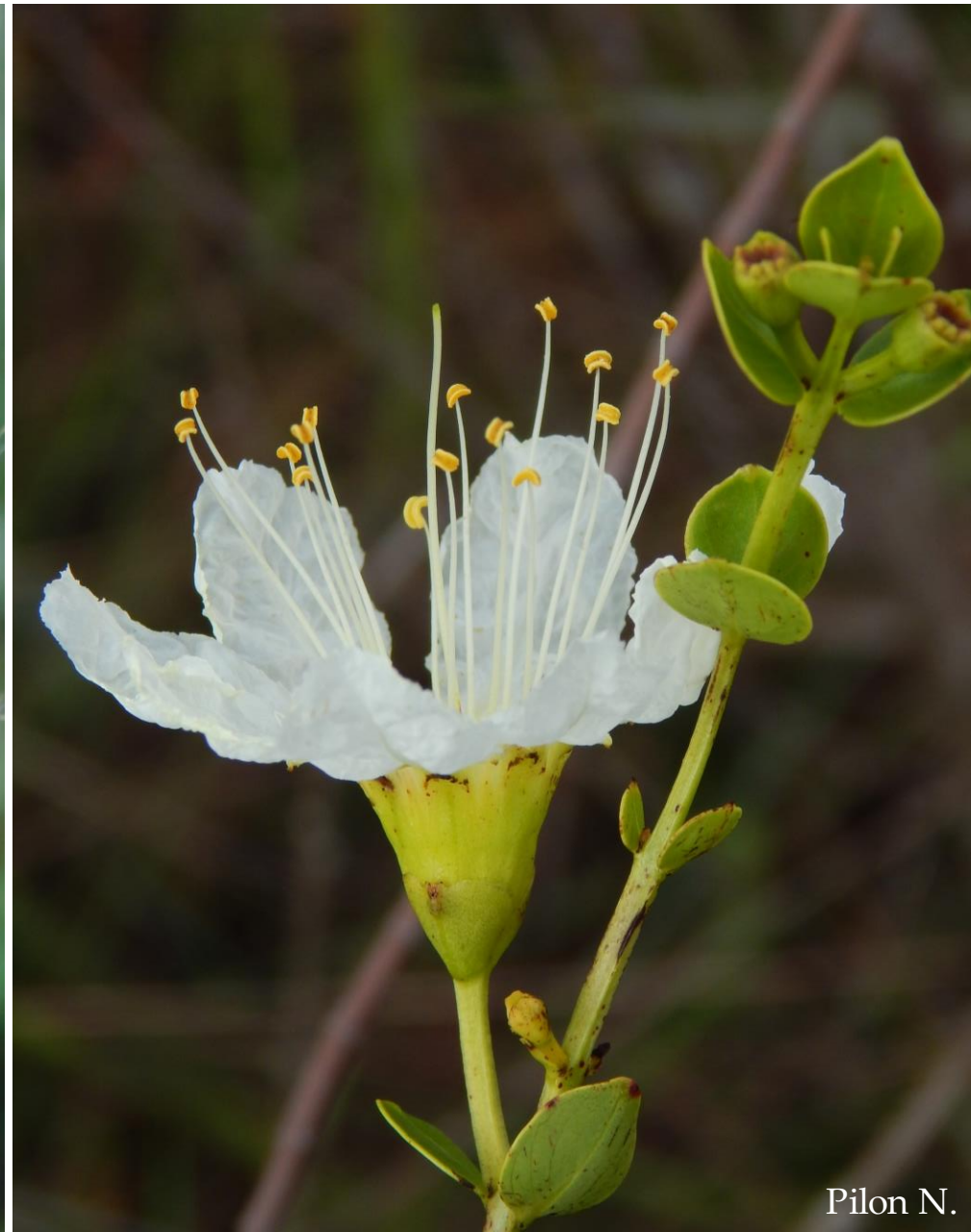
Lafoensia nummularifolia A.St.-Hil.